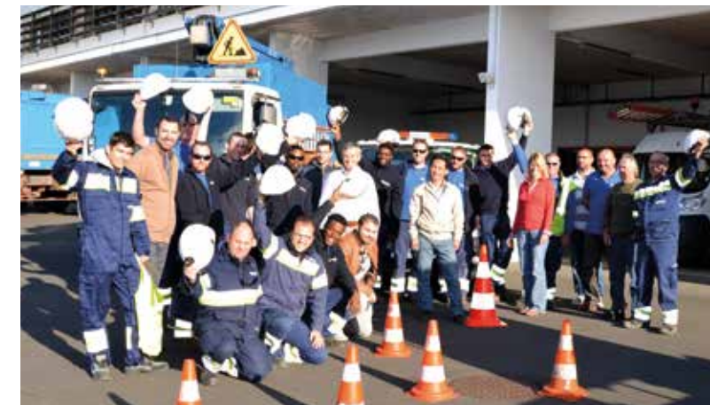
Collaborateurs de l'agence exploitation de Niort.

Les femmes et les hommes qui œuvrent au quotidien sont bien sûr le cœur de la réussite de nos entreprises. Le bien-être de nos agents et la qualité de vie au travail sont des conditions primordiales à leur évolution et à leur épanouissement professionnel.