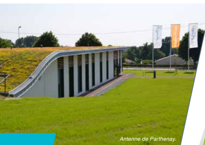
Antenne de Parthenay.

Plus généralement, le Groupe a mis en place un programme d'actions pour réduire et maîtriser l'impact de ses activités sur l'environnement, notamment grâce au recyclage systématique des déchets, et pour minimiser les consommations de ressources (électricité, eau, papier, carburant).