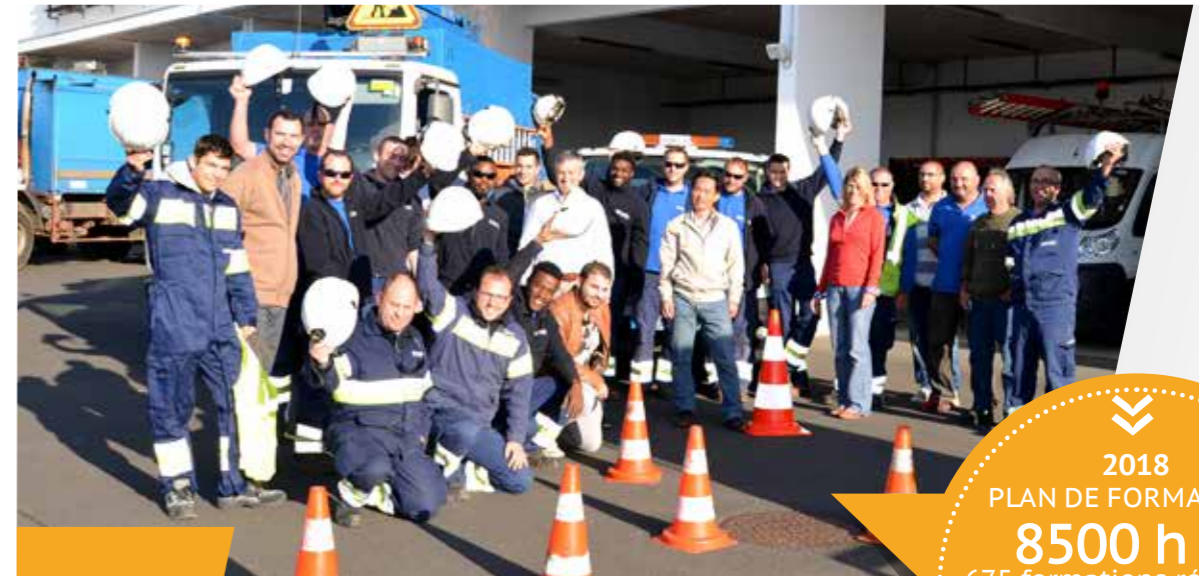
Collaborateurs de l'agence exploitation de Niort.

Nous considérons que les femmes et les hommes, qui œuvrent au quotidien dans notre entreprise, sont essentiels dans la réussite de ses activités. Le bien-être de nos agents et la qualité de vie au travail sont des conditions primordiales à leur évolution et à leur épanouissement professionnel.