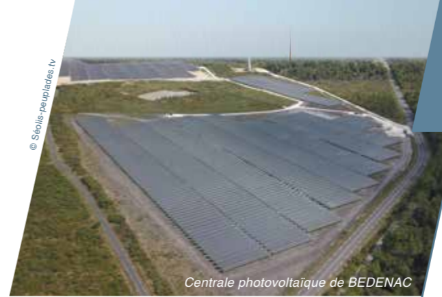
Centrale photovoltaïque de BEDENAC